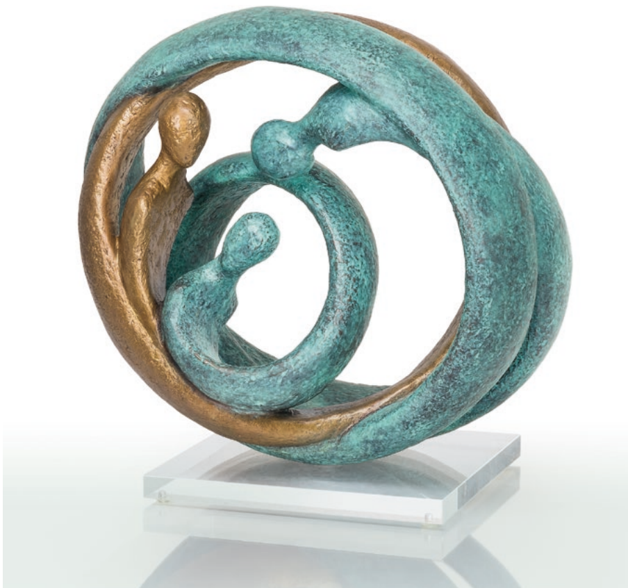
Family II · Bronze, patiniert, Acrylglasplatte · 31 x 32 x 20 cm

Neben Serien rein malerischer oder eben rein skulpturaler Umsetzung entstehen Kombinationen, bei denen durch eine auf bzw. vor die Leinwand montierte Figur die eindimensionale Bildtafel dreidimensional erhöht wird. Ihre Objekte erarbeitet die Künstlerin aus ‚Zellukat‘, einem Materialmix aus Steingranulat und Zellulosefasern mit Kunststoff, welches sie während ihres Studiums selbst entwickelt hat.