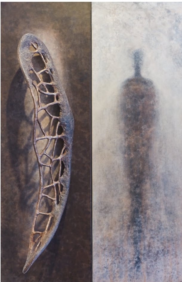
LOST WINGS · 2016 · Acryl, Zellukat auf Leinwand · 120 x 80 cm