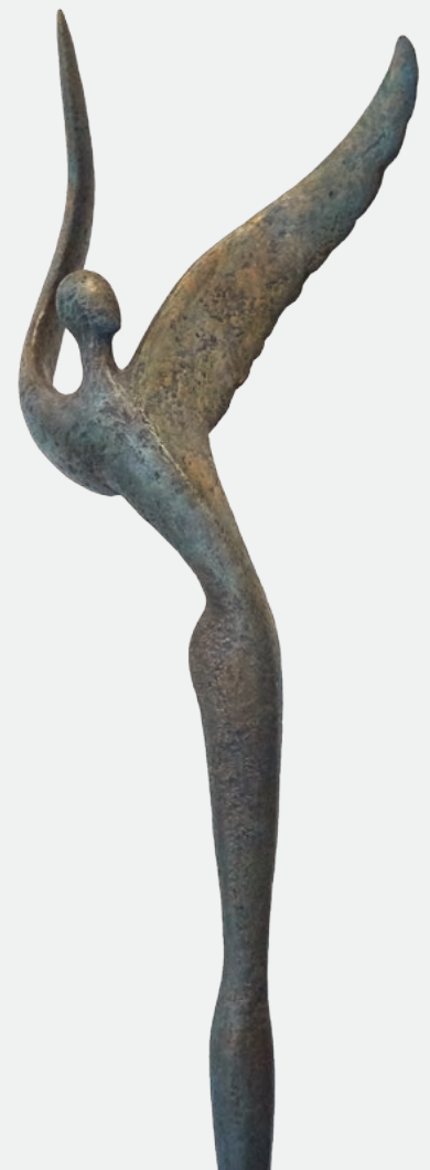
Cosmic Dancer · 2018 · Acryl, Zellukat

Neuerdings entstehen auch Arbeiten bzw. Auflagen in Bronze, die sie in enger Zusammenarbeit mit den Kunstgießereien Petit & Edelbrock sowie Strassacker umsetzt.