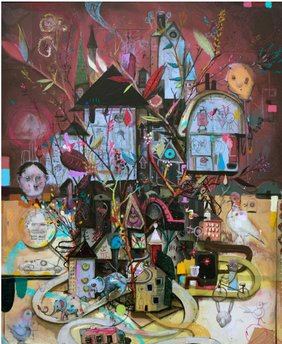
Urban Gardening · 2017 · Acrylfarbe, Collage, Zeichnung auf Leinwand · 150 x 120 cm

Welf Schiefer zieht seine Sujets und Figuren aus den verschiedensten Bildmedien, findet sie in Tageszeitungen, Illustrierten oder im Bildertrash der Werbung. Kunstgeschichtliche Rückgriffe, Vorbilder ergänzen und strukturieren dieses Ausgangsmaterial; unübersehbar in Schiefers Bildern sind Anspielungen auf Max Ernsts surreale Montagen von Illustrationen aus Trivialmedien; oder auf den kritisch-sarkastischen Zeichenduktus von George Grosz oder Otto Dix.