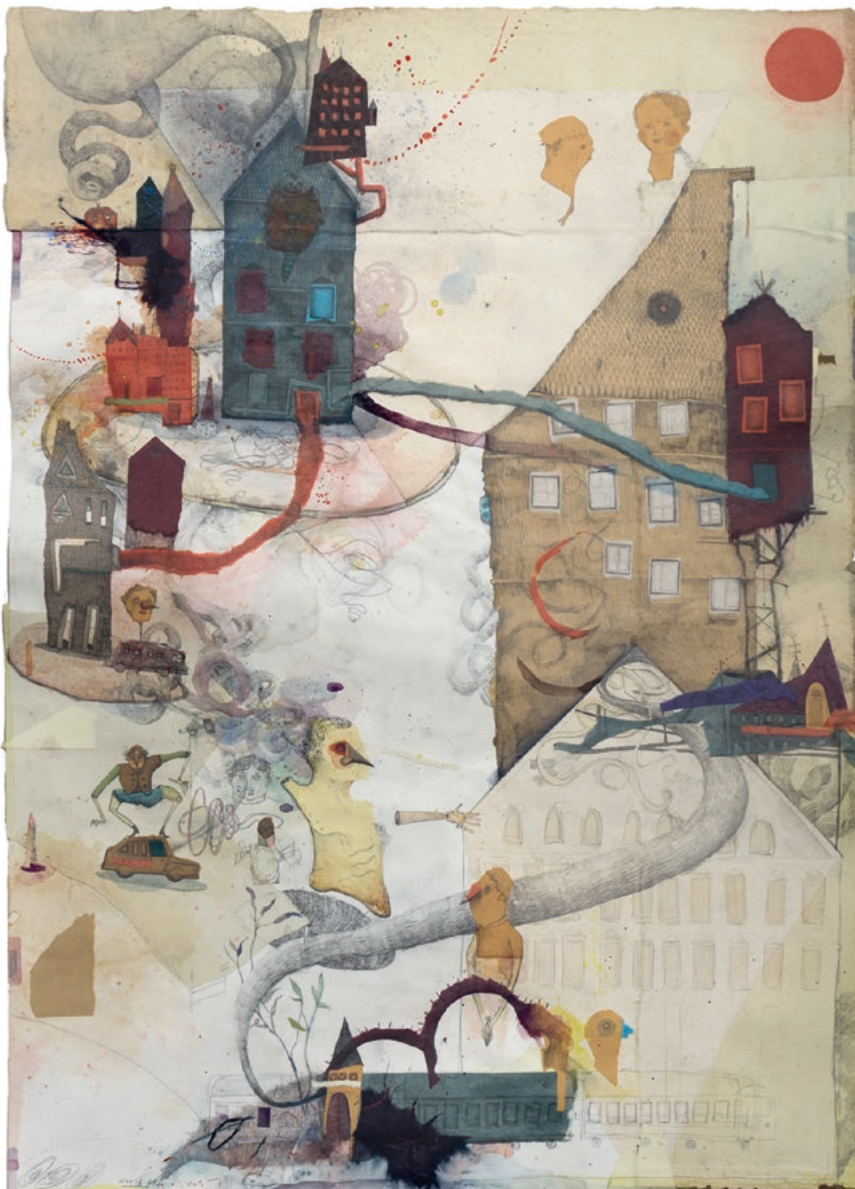
Humbarg 2 · 2017 · Mixed material auf Papier · 84 x 61 cm

sie eben – so kuriose wie marode Marionetten ihrer selbst – Unglücks-kandidaten in aussichtslosen Situationen. Doch bevor diese Figuren voll-ends in zynischer Bösartigkeit und Hoffnungslosigkeit zu Grunde gehen, werden sie gerettet – von Schiefers eigentümlichem Zeichenduktus. Die Menschen-Figuren, aber eben auch die Mäuse, Schafe, Hunde, Hühner als Menschen-Figurationen werden gerettet wie bei einem happy end, dessen Künstlichkeit man im Augenblick der Rettung so sehr begrüßt wie vergißt.