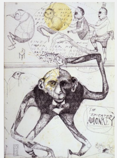
Educated Monkey · 2011 · Radierung · 70 x 50 cm

Denn Schiefers Zeichenduktus kommt seinen hart geprüften Figuren am Ende zur Hilfe. Mit freundlicher Ironie, verschmitzter Verspieltheit, mit Liebe zum skurilen Detail rettet er seine Figuren aus der aussichtslosen Situation, in die er sie zuerst gestellt hat. Eigentlich stehen sie kurz vorm Abgrund – aber nun machen sie eine – im doppelten Sinne – wunderbare Figur.