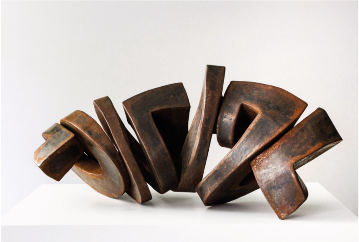
Bodenfrucht • 2012 • Corten-Stahl • 31 x 85 x 32 cm