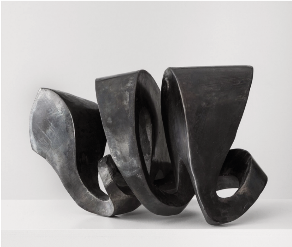
Neuland 17 • 2018 • Corten-Stahl • 31 x 42 x 28 cm