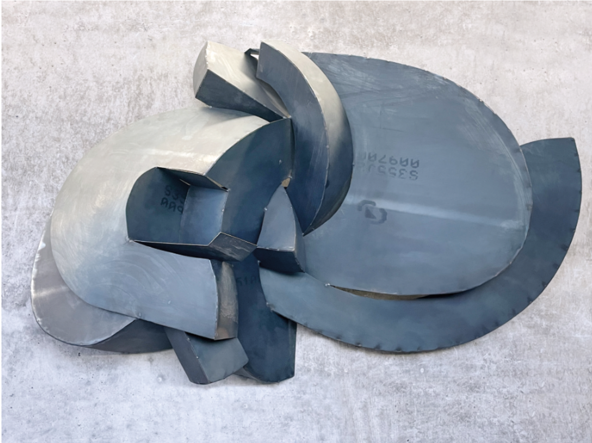
Wolke II • 2022 • Corten • ca. 180 cm breit