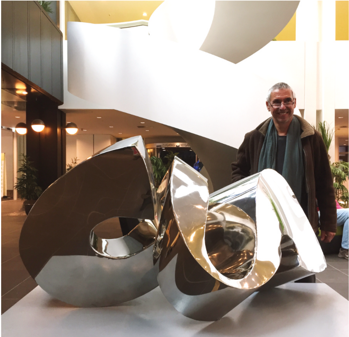
Reflektor • 2008 • Edelstahl, poliert • 151 x 84 x 80 cm