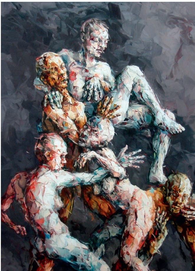
»Aus der Mitte« · 2016 · Ölfarbe auf Leinwand · 220 x 160 cm«

„... Etwas Existentielles kennzeichnet die Bilder Eberhard Bitters, eine eigene, sonderbare Spannung und Dynamik, die sich in ihnen ausdrückt. Eberhard Bitters Zeichnungen und seine Malerei sind für mich wie eine Arbeit am Mythos, eine Abarbeitung an dem, was den Menschen bestimmt, was der Mensch ist.