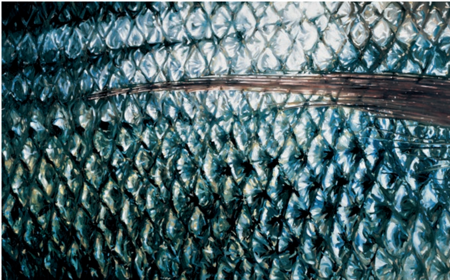
»NACHTJÄGER« · 2003 · Ölfarbe auf Leinwand · 180 x 290 cm

„... Angeregt und inspiriert durch seinen Lehrer Prof. Kuhna entwickelt Lars Reiffers früh seine künstlerische Handschrift, formt und modelliert sie kontinuierlich weiter. ... Am Beginn des künstlerischen Prozesses steht die Sammlung und Dokumentation: Waren es im französischen Aix die mittelmeerischen Märkte, die ihm Fische in allen Farben, Größen und Arten boten, sind es im heimischen Köln Flora und Fauna, die er im großzügig angelegten Garten seiner Eltern vorfindet. Die Kamera erfüllt dabei den Zweck eines Archivs; die auf diesem Wege regelrecht katalogisierten einzelnen Blumen und Blätter, Fische und Tiere bilden eine Art Asservatenkammer ...“