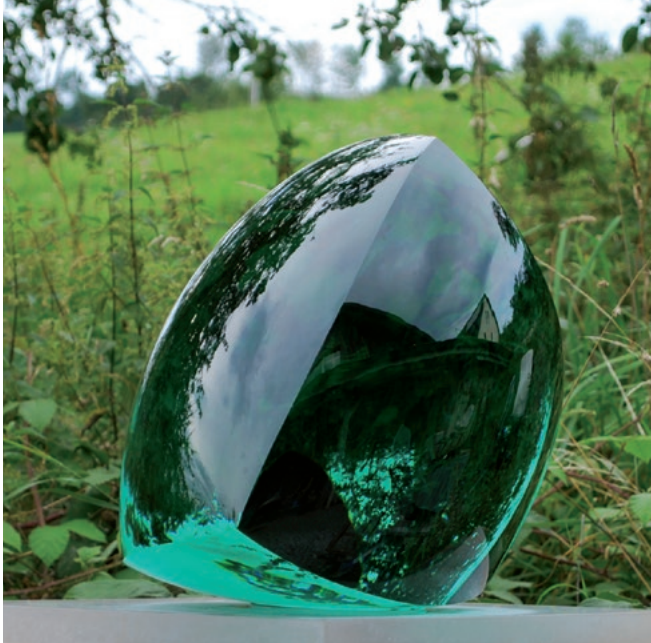
»AIR III« · 50 cm

Die auf einem winzigen Auflagepunkt ausbalancierten und dadurch beweglichen Skulpturen überraschen und beglücken durch ihre unerwartete Leichtigkeit und ihre sinnliche Emotionalität, die die Betrachter unwillkürlich zum Anfassen bewegen.