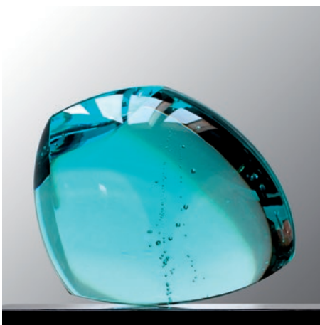
»AIR I« · 2014 · Massivglas geschliffen, poliert · 22 x 13 x 18 cm

Die auf einem winzigen Auflagepunkt ausbalancierten und dadurch beweglichen Skulpturen überraschen und beglücken durch ihre unerwartete Leichtigkeit und ihre sinnliche Emotionalität, die die Betrachter unwillkürlich zum Anfassen bewegen.