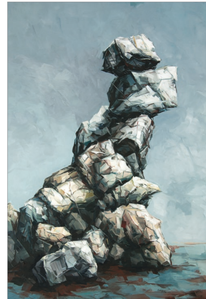
ZUGEHÖRIG · 2017 · Ölfarbe auf Leinwand · 200 x 140 cm