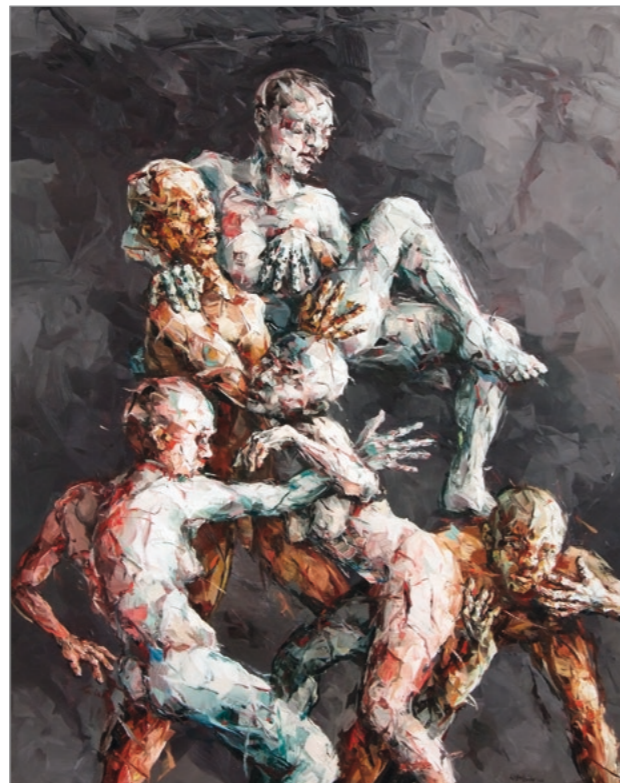
AUS DER MITTE · 2016 · Ölfarbe auf Leinwand · 220 x 160 cm

Doch nicht nur wir als Betrachter lassen die Bildteile und Motive in Austausch und Beziehung miteinander treten, der Maler selbst stellt eine bestimmte Form des Kommunizierens dar. Viele seiner Bilder sind von der ‚Contact-Improvisation‘ inspiriert, einer spontan-tänzerischen Aktion, in welcher sich der Dialog der Körper frei entwickeln kann, und zwar jenseitig unserer stereotypen Bewegungsabläufe und Körperhaltungen. Die Contact-Improvisation buchstabiert ein neues Alphabet der Körpersprache, rätselhaft bisweilen, überraschend im Gestus, offen gegensätzlich und kaum abschließend zu deuten. ...“