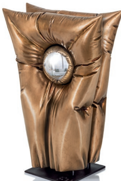
Exemplarische Skulpturen aus Fundstücken/Sandsteinmasse bzw. Bronze