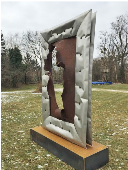
»Shot 1« · Außenbereich der Messe

Dabei versteht sich das Textile nicht nur als Material wie z. B. bei den großformatigen Tapisseries, sondern auch formbezogen als Außenhaut und Formgeber seiner skulpturalen Objekte. Die an Kissen erinnernde Formen werden durch spartanisch gesetzte, mechanische wirkende Schraubverbindungen und Schnürungen der gegossenen Sandsteinmasse bzw. der so geformten Stahlbleche erzielt. Diese Vorgehensweise und die Endform besitzen im europäischen Kunstmarkt Alleinstellungsmerkmal.