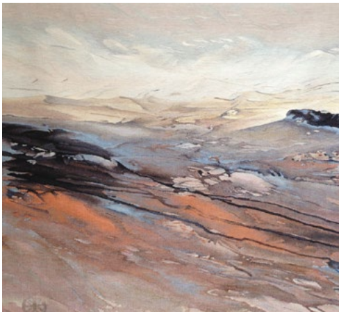
Tapiserie »Kufra« · 130 x 140 cm