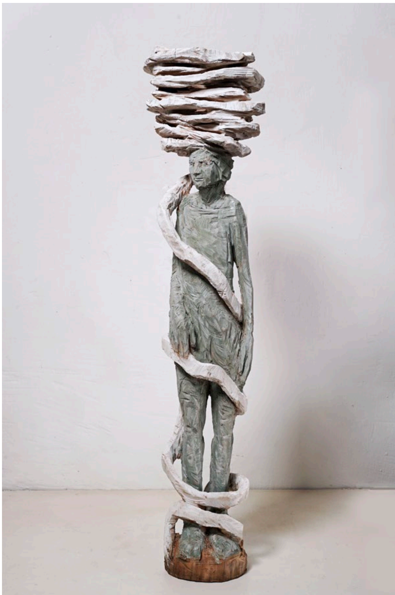
Geduldsfaden · 2019 · Platane, farbig gefasst · 107 x 27 x 20 cm

„Die Skulpturen der Sieglinde Gros sind Gezeichnete. Aus Holz gesägt, gehauen, oft mit Farbe überzogen, zeigen die wie in Ferne und Unschärfe ausgedünnten Figuren aus der Nähe die ganze Härte ihres materialen Gewordenseins. Spuren, Schnitte, Grate, Kerben weisen die Holzmenschen als scharf gezeichnete Individuen aus. Zugleich stellen sie die Allgemeingültigkeit einer existenzialistischen Aussage dar. Sind die Einzelfiguren noch eher als Portraits erkennbar, verschwindet der Einzelne gesichtslos in den aufragenden, zunehmend abstrahierten Figurenbündeln, die Fragen nach Gesellschaft und Vergesellschaftung, nach Ort und Sein des Menschen aufwerfen.“