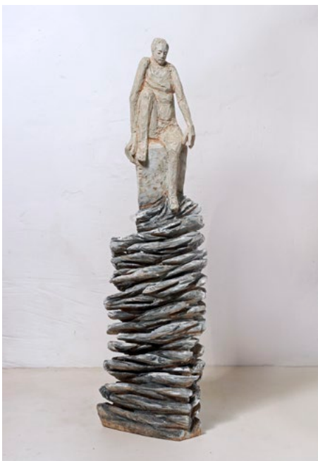
Aus dem Meer · 2019 · 107 x 29 x 20 cm

„... Man vergleicht sich nicht direkt mit den Figuren, aber mit den eigenen Gedanken und Gefühlen kommen wir ihnen sehr nah. Denn die Künstlerin zeigt genau jenen Moment, wo der Mensch sich seines weiteren Potentials gewahr wird und versucht, eben mit uns unsere beschränkte Wahrnehmung zu verlassen. Im Bruchteil einer Sekunde verändern ihre Figuren ihre Haltung. Eine leichte Drehung, ein Schritt nach vorn oder zur Seite. Mit einem Strecken und über sich Hinauswachsen gelingt es der Künstlerin bei den Gruppen wie den Einzelfiguren, diese so nebeneinander und einander gegenüber stehend aufzubauen, dass sie von einer Sprach- und Ausdrucksvielfalt sind, die von unseren Fähigkeiten zu Humanität, Mitmenschlichkeit oder Mitgefühl erzählen können. Es gelingt ihr derart eindrucksvoll, dies als wirkmächtigen Faktor in unserem seelischen Erleben aufzuzeigen, dass es einem den Atem nehmen kann!