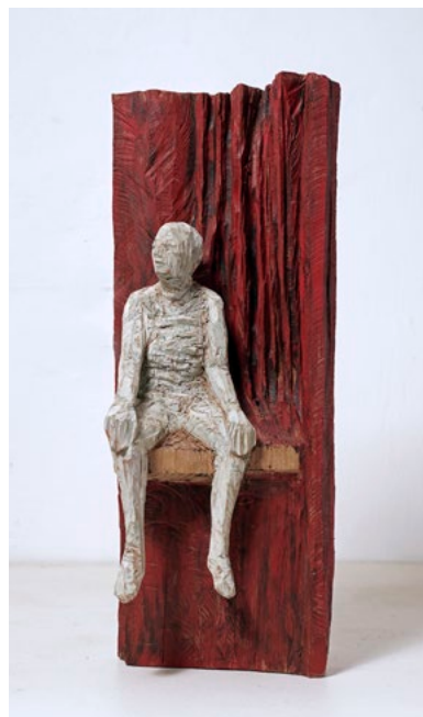
Ansitz · 2019 · 56 x 20 x 20 cm

... Die Abstraktion, bedingt auch durch die Wahl des Werkzeuges, mit dem jeweils gearbeitet wurde, wird lesbar als eine von vielen Möglichkeiten, die durch unsere Entscheidungen getroffen werden können. Eine nicht fassbare Unvergänglichkeit findet in diesem künstlerischen Werk seinen Ausdruck, die der Mensch vielleicht in der Liebe, der Philosophie, dem Glauben oder im All erfährt. Sie hat sie wiedergefunden für uns: die Ewigkeit.“