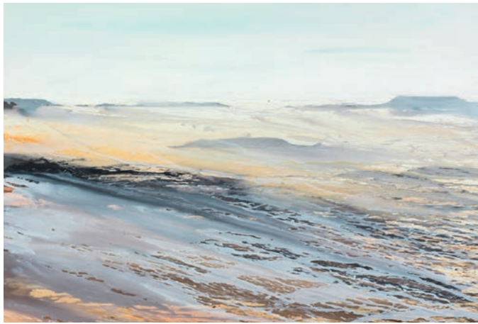
BIR EZZOBAS · 2014 · Aquarell auf Papier · 70 x 100 cm