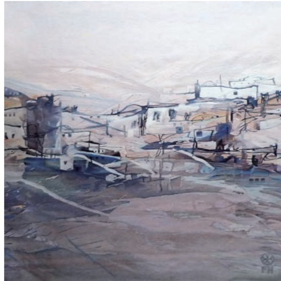
DOUZ · 2009 · Tapiserie · 200 x 200 cm