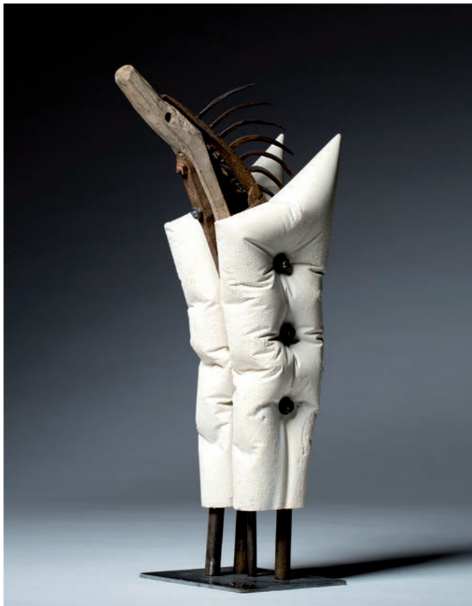
HEAD I · 2014 · Holz, Metall, Sandsteinmasse · ca. 52 cm hoch