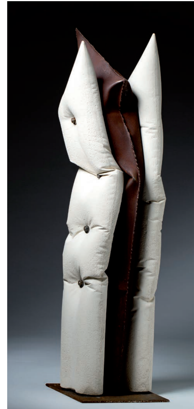
AFFECTION II · 2014 · Metall, Sandsteinmasse · ca. 100 cm hoch