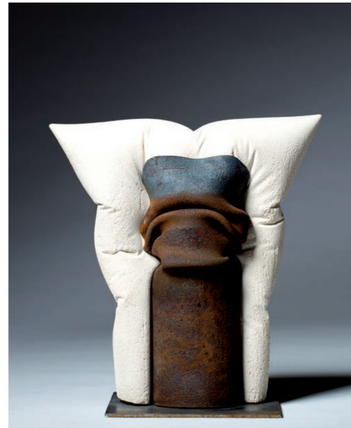
SQUEEZED IV · 2014 · Metall, Sandsteinmasse · ca. 30 cm hoch