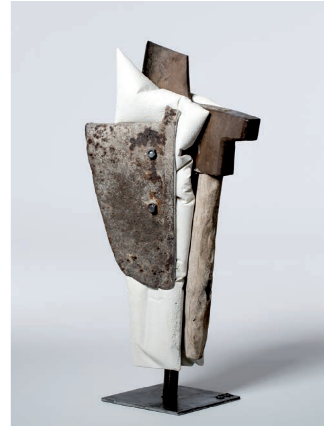
CRISIS · 2014 · Holz, Metall, Sandsteinmasse · ca. 52 cm hoch

vertreten durch ART-isotope · Galerie Schöber, Dortmund