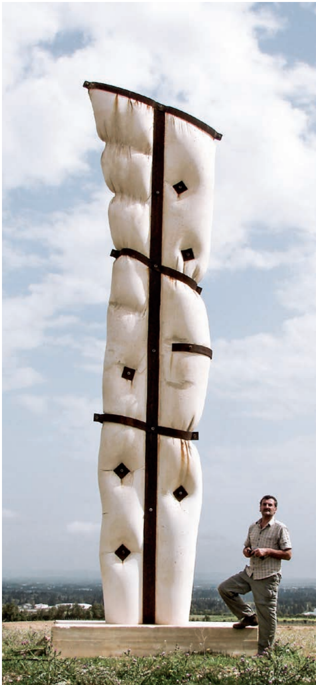
LIBERATION · 2005 · Metall, Sandsteinmasse · ca. 9 m hoch