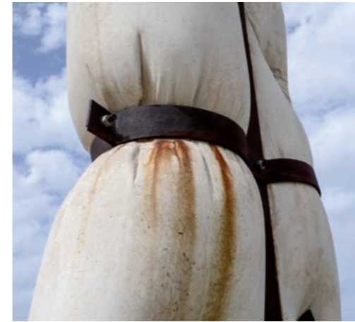
LIBERATION (Detail) · Bou Argoub, Tunis/Tunesien

Die von diesen Aufenthalten mitgebrachten Fundstücke und Artefakte des täglichen Lebens werden mit den skulpturalen Objekten kombiniert und erhalten somit – außerhalb ihres ursprünglichen Kontextes – als Kunstform eine andere Funktion und zugleich eine neue Bedeutung im Sinne einer Rekontextualisierung.